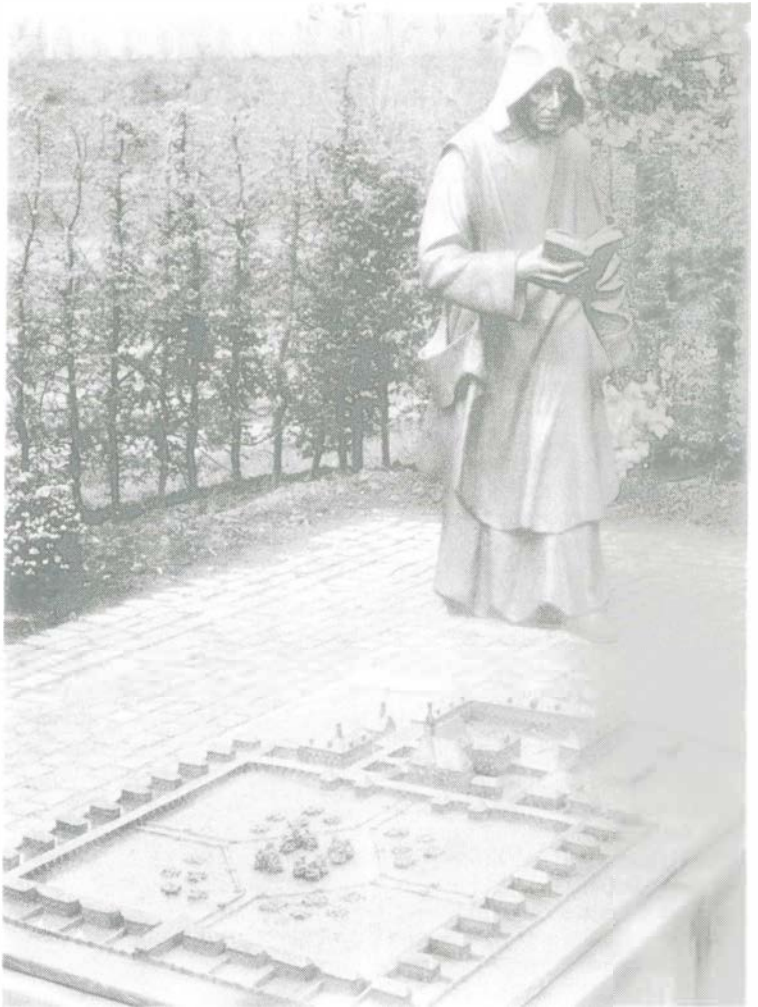
Erinnerungsstätte „Kartäuser-Kloster Düsseldorf-Unterrath“