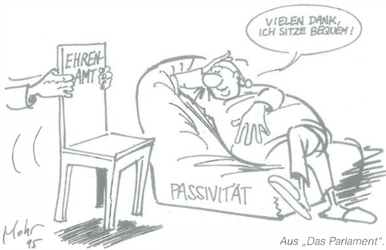
Aus „Das Parlament“.