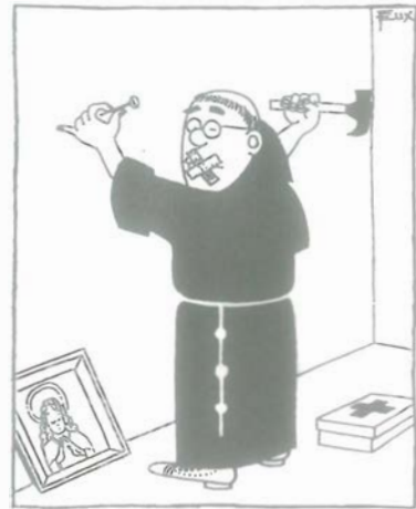
Beihilfe zur Tugend.

Unweit der Insel entsteht ein neuer Ort, der, wie das Museum Insel Hombroich, in Kürze internationalen Ruf erhalten wird. Eine ehemalige Nato-Raketenstation, ca. 900 m vom Park-