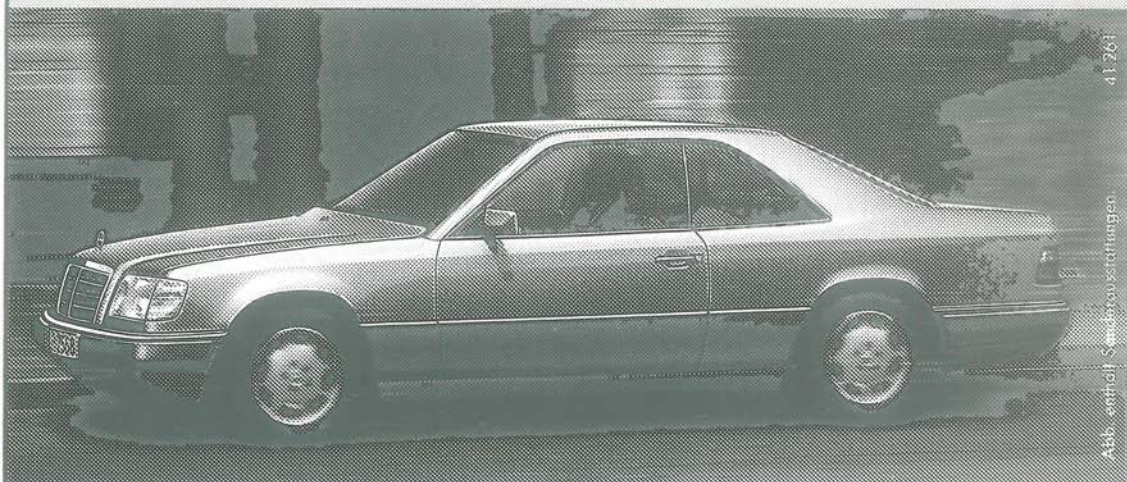
Abb. enthält Sonderausstattungen. 41261