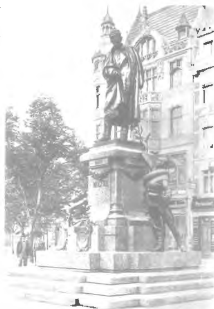
Das Moltkedenkmal, das ebenfalls auf der alten Alleestraße stand, ist im Bombenkrieg zerstört worden