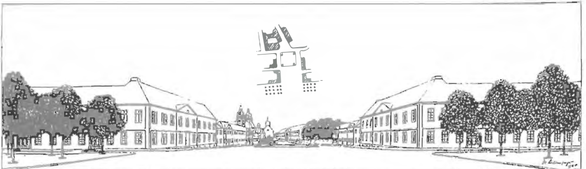
Rekonstruktion der von A. v. Vagedes geplanten Randbebauung des Mühlenplatzes (Grabbeplatz) (Zeichnung: J. Sültenfuß, 1924)

Während Ende des 19. Jhs. durch den Bau der Kunsthalle der Platzcharakter und damit die Grundidee der städtebaulichen Perspektiven zerstört wurde, so ist durch den Bau der Kunstsammlung Nordrhein-Westfalen jetzt der alte Gedanke des nach Osten abgeschlossenen Platzes teilweise wieder durch den nach Süden einschwenkenden Flügel der Kunstsammlung aufgegriffen worden. Durch dieses Bauelement wird der Charakter des nach Osten abgeschlossenen Platzes wieder zwingend betont, was übrigens auch durch die vorgesehene Abstufung des Platzes zur Altstadt und die damit verbundene Niveauangleichung unterstrichen wird. Wenn der Platz auch nicht so deutlich nach Osten abgeschlossen ist wie seinerzeit durch den riegelartigen Bau des Seminars, so ist die Grundidee der Freifläche und damit die Einpassung in die alte städtische Grund- und Verkehrsstruktur wieder gewährleistet. Damit ist auch die Identität der historisch gewachse-