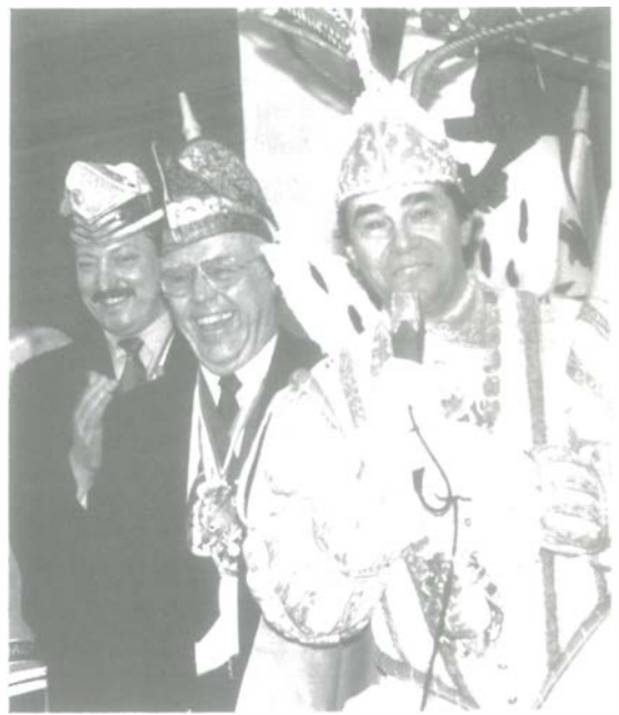
Auch die Tollitäten kommen an den Jonges nicht vorbei. Beim alljährlichen Prinzenempfang (hier im Vorjahr) merken die Karnevalisten schnell, daß sie unter Freunden sind. Kein Wunder: auch sie sind zumeist Jonges.