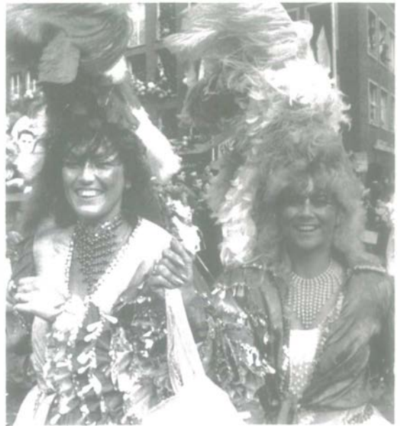
Aufgepaßt Jonges, gefährliche Wegstrecke! Und das im Karneval nicht nur am Rosenmontag vor dem Rathaus.

Da sind zunächst einmal die Finanzen. Bislang gibt es noch einen Zuschuß der jeweiligen Stadt. Doch das wird in