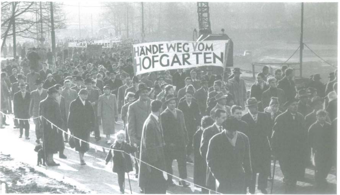
Ein Bild, das für sich spricht. An dieser Demonstration 1960 waren auch die Jonges in großer Zahl beteiligt.