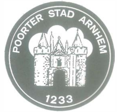
Signum der Arnheimer Brauchtumsfreunde.

Bezugspreis im Jahresabonnement bei Zustellung durch die Post DM 40,00 einschl. Postgebühren und MwSt. (Inland). Einzelheft DM 2,80 einschl. MwSt. Anzeigenwerbung und -verwertung, Vertrieb und technische Herstellung: Tritsch Druck und Verlag GmbH & Co KG, Herzogstraße 53, 40215 Düsseldorf, Telefon (02 11) 3 86 36-0, Telefax 3 86 36 13. Gültig ist Anzeigen-Preisliste Nr. 17 vom 1.1.1995.