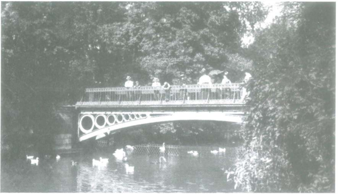
Einer der schönsten Hofgartenblicke auch heute noch: Die Goldene Brücke im Jahre 1900.