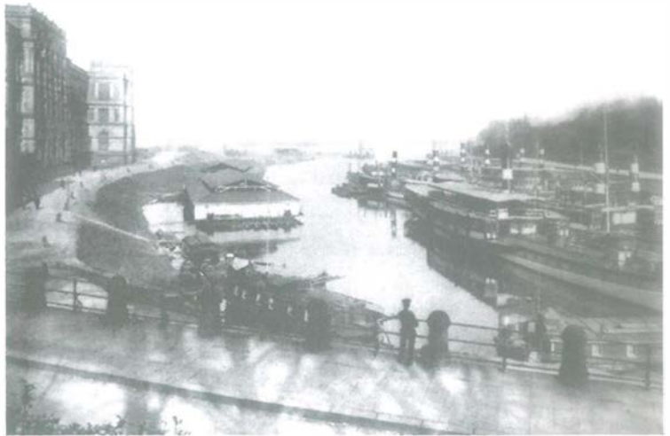
Aus Düsseldorfs Hafengeschichte: Blick auf den Sicherheitshafen (links die Kunsthochschule) — vor dem Bau der Oberkasseler Brücke.

Hektar Land- und 54,5 Hektar Wasserflächen. Vorausschauend wurde durch die Anlage einer Gleisverbindung zum Bahnhof Bilk und mit einem 17 Kilometer umfassenden Schienennetz innerhalb des Hafens bereits vor der Jahrhundertwende sichergestellt, daß der Düsseldorfer Wirtschaftsraum alternativ über den Wasser- oder Schienenweg oder in Kombination beider Verkehrsträger versorgt werden konnte. Bis heute hat sich das