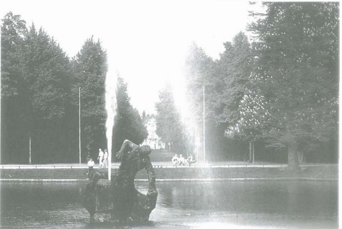
Der „Grüne Jong“ im Hofgarten, 1900 von J. C. Hammerschmidt geschaffen.