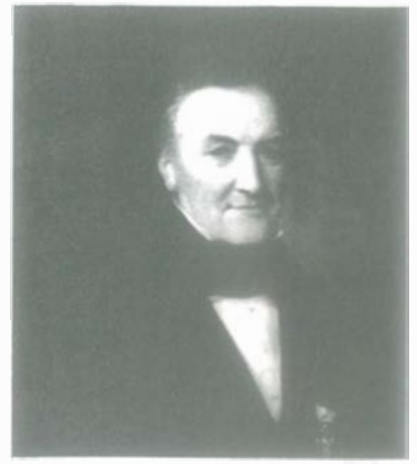
Maximilian Friedrich Weyhe um 1842.

Weyhe wurde am 15. Februar 1775 in Poppelsdorf geboren, 1803 kam er nach Düsseldorf. Diese Stadt, sowie Kleve und Krefeld, waren seine wesentlichen Wirkungsfelder. Als er am 28. Oktober 1846, einen Tag nach seinem Tode, zu Grabe getragen wurde, ging durch „seinen Hofgarten“ ein gewaltiger Trauerzug. Auf dem Golzhei-