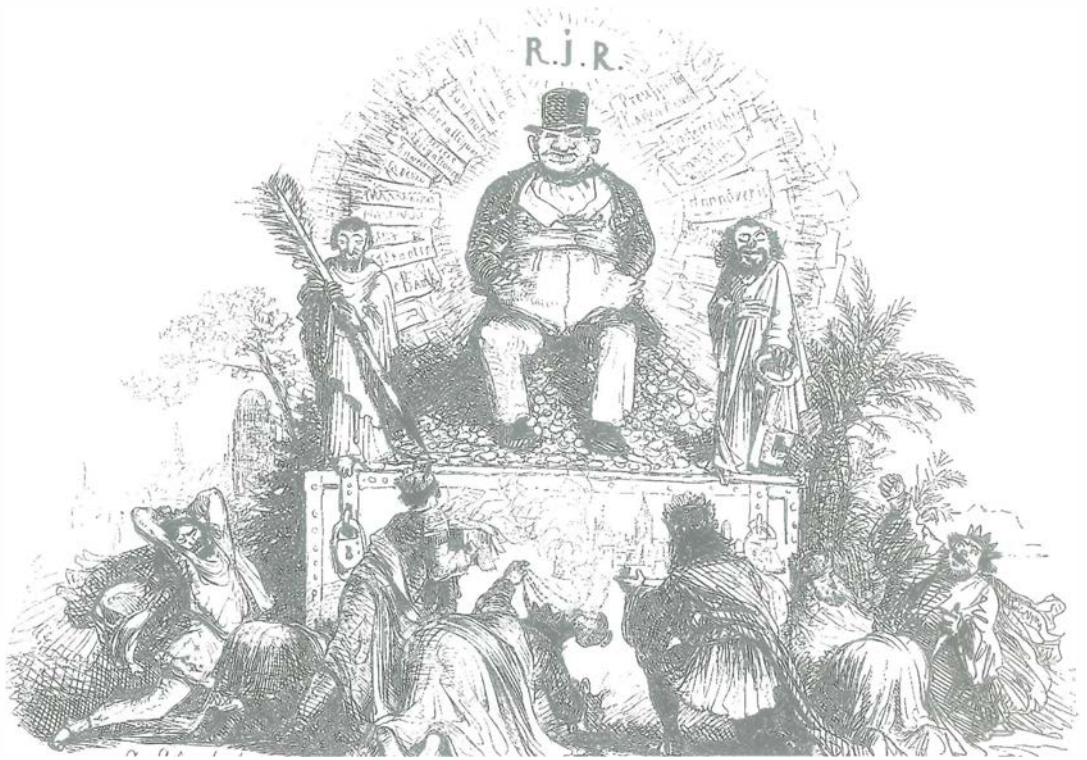
„Anbetung des Götzen“ betitelt A. Achenbach diese Zeichnung aus dem Jahre 1848 und ging damit auf die gesellschaftliche Situation dieser Zeit ein: Die Reichen wurden immer reicher, die Armut auch in Düsseldorf war allumfassend, der Nährboden für die Revolution.