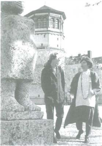
DAMEN-TRIO AM SCHLOSS-TURM – mit diesem Bild wirbt die Stadt Düsseldorf in einem Prospekt „Für qualifizierte Mitarbeiterinnen in den Betrieben“ und weist auf Finanzierungshilfen hin. Da wir im TOR fast immer Männer zeigen, war es uns ein Bedürfnis, diese Einseitigkeit einmal bildlich aufzulockern. Wie gefallen Ihnen die Damen, vor allem die links außen stehende?

Ich bedaure, in meinen Schriften zuweilen von heiligen Dingen ohne die ihnen schuldige Ehrfurcht gesprochen zu haben, aber ich wurde mehr durch den Geist meines Zeitalters als durch meine eigenen Neigungen fortgerissen. Wenn ich unwissentlich die guten Sitten und die Moral beleidigt habe, welche das wahre Wesen aller monotheistischen Glaubenslehren ist, so bitte ich Gott und die Menschen um Verzeihung. Ich verbiete, daß irgendeine Rede, deutsch oder französisch, an meinem Grabe gehalten werde. Gleichzeitig spreche ich den Wunsch aus, daß meine Landsleute, wie glücklich sich auch die Gesetze unsrer Heimat gestalten mögen, es vermeiden, meine Asche nach Deutschland hinüberzuführen; ich habe es nie geliebt, meine Person zu politischen Possenspielen herzugeben. Es war die große Aufgabe meines Lebens, an dem herzlichen Einverständnis zwischen Deutschland und Frankreich zu arbeiten und die Ränke der Feinde der Demokratie zu vereiteln, welche die internationalen Vorurteile und Animositäten zu ihrem Nutzen ausbeuten. Ich glaube mich sowohl um meine Landsleute wie um die Franzosen wohlverdient gemacht zu haben, und die Ansprüche, welche ich auf ihren Dank besitze, sind ohne Zweifel das wertvollste Vermächtnis, das ich meiner Universalerbin zuwenden kann.