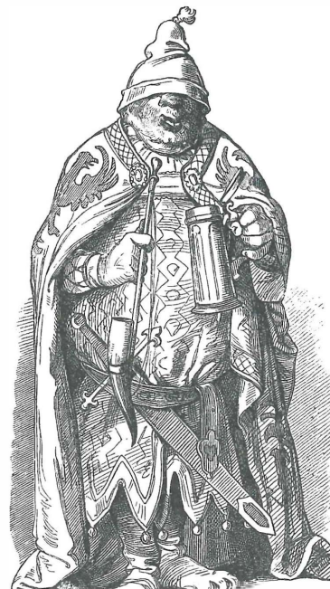
So sahen die „Düsseldorfer Monatshefte 1848/49“ den klassischen deutschen Michel jener Jahre.

Die Kölner scherten sich nicht drum. Kaum waren dort die Pariser Ereignisse bekanntgeworden, beschloß der Gemeinderat am 7. März, eine Petition nach Berlin zu schicken, die eine Demokratisierung des Wahlgesetzes, die sofortige Aufhebung der Zensur und mehr Volksbeteiligung bei den Bundesbehörden forderte. Auf Druck der Straße wurden die Forde-