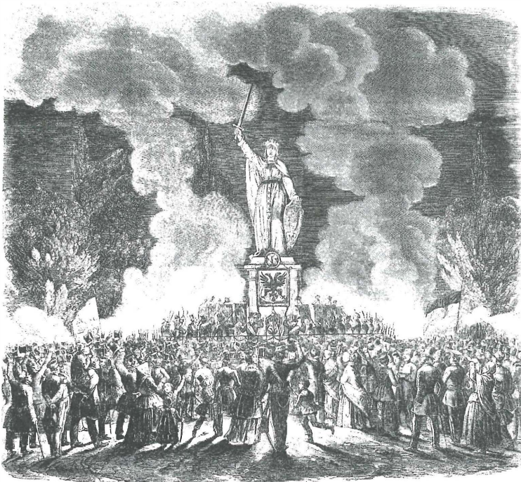
Am 6. August 1848 wurde in Düsseldorf ein „Fest der deutschen Einheit“ gefeiert — mit dieser prachtvollen Germania. Wie es dazu kam, lesen wir im Revolutionsbericht der nächsten Ausgabe.

rungen schnell erweitert: Freiheit der Rede und Presse, Aufhebung des stehenden Heeres zugunsten einer allgemeinen Volksbewaffnung, freies Vereinigungsrecht, Schutz der Arbeit und Sicherstellung der menschlichen Bedürfnisse aller und vollständige Erziehung aller Kinder auf öffentliche Kosten. „Ungeheuerlich“, brummte der König — die Revolution war da.