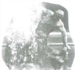
Pate des Denkmals "Grüne Jong" im Hofgarten der Stadt Düsseldorf

Filialdirektion Düsseldorf Berliner Allee 34-36 40212 Düsseldorf