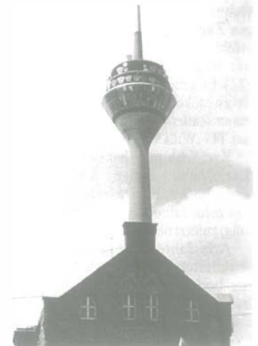
Wird der Rheinturm neu fundamementiert?

„Dieser kosmopolitischen Orientierung verdankt Düsseldorf sein weithin bekanntes und geschätztes weltstädtisches Flair. Die Symbolfigur Ihrer Stadt ist der Radschläger – eine sehr dynamische Gestalt mit Mut zur unkonventionellen Haltung.“ Auch sie werde diesem Anspruch gerecht.