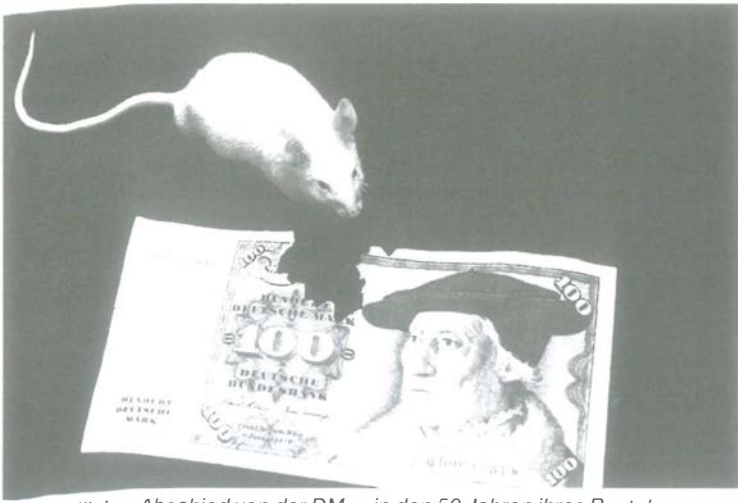
Sinnbildlicher Abschied von der DM – in den 50 Jahren ihres Bestehens wurde sie kräftig angeknabbert.