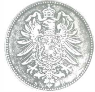
Geld ist eine vergängliche Ware.

seligkeit eingeflochten werden. Aber da verlasse ich mich am besten auf die ganz persönlichen Lebenserfahrungen jedes einzelnen Jong. Und schließlich hat die Frau zu Hause da auch noch ein Wörtchen mitzureden. Der Mann, die Frau, das Geld – zumindest hier hat die Sprachgeschichte die Artikel geschlechtsspezifisch gerecht verteilt.