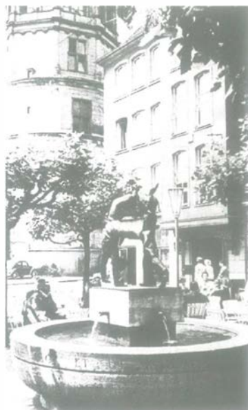
Wenn alle Brunnlein fließen (würden).

Es hilft alles nichts, wir brauchen für ein lebendiges Stadtbild unsere Wasserkunst. Sie steht symbolisch für Kraft und Lebensfreude, Eigenschaften also, die zum Image der weltoffenen Stadt Düsseldorf bestens passen. Zwei weitere Aspekte sollten die Sparkommissare im Hochbauamt und in den Stadtwerken nicht vergessen: Eine ganze Reihe Brunnen stehen auf der Denkmalschutzliste oder sind als Kunstwerke eingestuft. Fließt kein Wasser, rinnt oder sprüht es auch nur minutenweise, ist das Kunstwerk in seinem Wert zumindest herabgesetzt, womöglich ist es gar keines mehr. Das