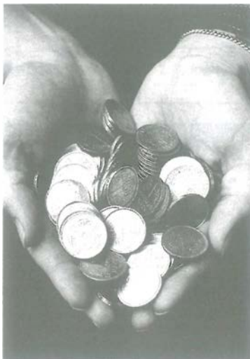
Auch diese Handvoll Geld ist bald nichts mehr wert.

Denn die Chancen der Währungsunion – größere Kalkulationssicherheit und Preistransparenz, Wegfall der Wechselkursrisiken und Sicherungskosten – dominieren die Risiken. Wichtig für die in Deutschland lebenden und wirtschaftenden Menschen ist dabei, daß ihr bisher in DM ausgedrücktes Geld als Euro seinen Wert nicht verliert. Durch die neue Währungseinheit entsteht keine Inflation. Die Wahrscheinlichkeit für deutlich höhere Geldentwertung ist aus heutiger Sicht äußerst gering. Bereits jetzt haben sich die Inflationsraten der Teilnehmerländer – auch der bisherigen sogenannten Weichwährungsänder – auf niedrigstem Niveau ein-