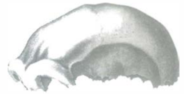
Die berühmte Schädelkalotte des Neandertalers

Ein aufregender wissenschaftlicher Fortschritt war die Entdeckung des Biogenetischen Grundgesetzes durch Haeckel, wonach der Entwicklungsablauf des Einzellebewesens eine kurze, gedrängte Wiederholung der Entwicklung des zugehörigen Stammes ist. Konkret: Ein sechs Wochen alter menschlicher Embryo schwimmt im Schutz des mütterlichen Amnions in einer salzhaltigen Flüssigkeit, wie es die Sauerstoff atmenden, im Wasser lebenden Vorfahren des Menschen vor fast einer Milliarde Jahren taten.