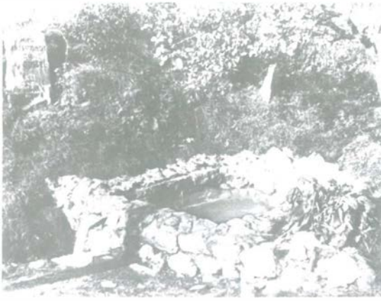
Die Düsselquelle — Zustand 1953

soll also über diesen Stein rieseln, in ein Kieselbett, und im Brunnen wieder versickern. Es wurde eine neue Fassung und Ablaufrinne gemauert, Planierungs- und Gartenarbeiten durchgeführt sowie eine Bank und ein Hinweisschild aufgestellt.