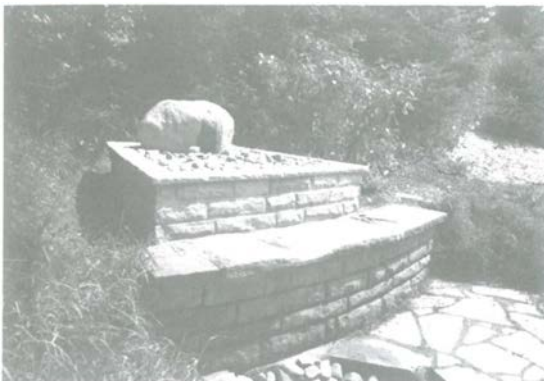
Die Düsselquelle — Zustand, wie ihn die Jonges am 27. Juli vorfinden werden.

Im Zuge der Buga-Neugestaltung wird die Düssel zur Mitgestalterin einer Art „Kö des Südens“. Herbert Schmitz-Porten wertet die Initiative der TG „Blutwoosch-Galerie“ als wertvollen Beitrag für die Rückbesinnung auf das historisch Fundamentale für unsere Stadt, die sich, so mahnt er, mit „Rhein, Strom und Brücken“ zu den Ufern immer neuer