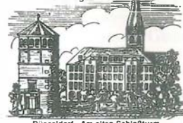
Düsseldorf - Am alten Schloßturn

Burgplatz 21-22 - Düsseldorf 1 - Tel. (02 11) 133161