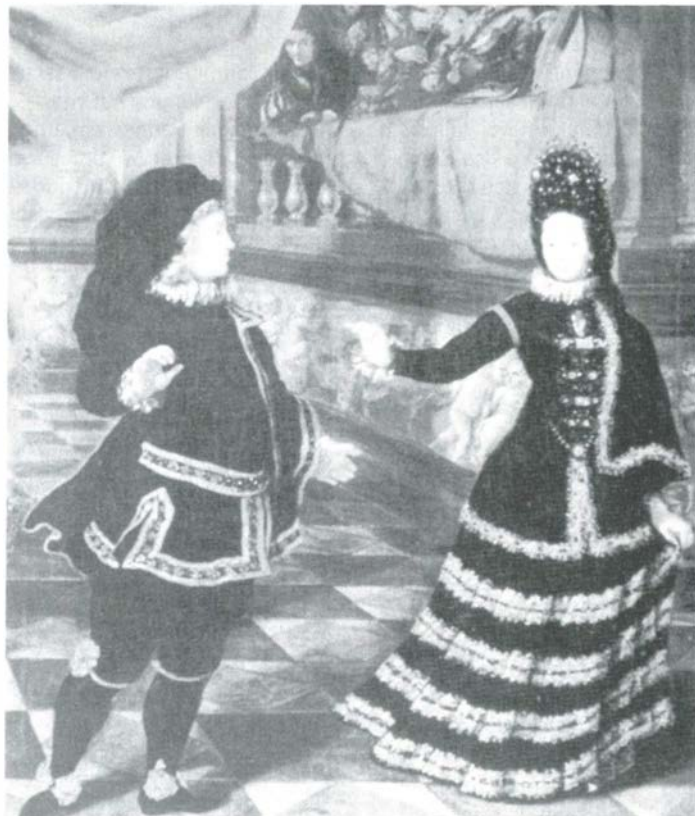
Jan Wellem und seine Frau Anna Maria Louisa beim Maskenball (Gemälde von J. F. van Douven)

Deutsches Fastnachtmuseum, Falterturm, 97302 Kitzingen, Öffnungszeiten: Sa/So 14 – 17 Uhr.