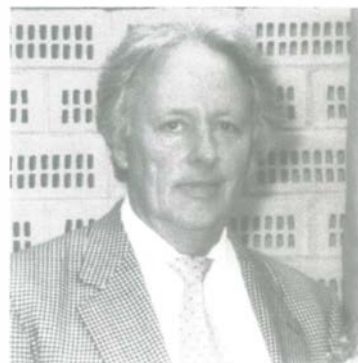
Der Baas im Kreuzverhör

13. Welche Laster haben Sie? Immer nur die schönen Dinge des Lebens genießen zu wollen. Ich bin nicht egoistisch genug.