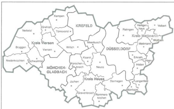
Das „Eurogabiet“ (ohne Niederlande), identisch mit der Region Düsseldorf/Mittlerer Niederrhein