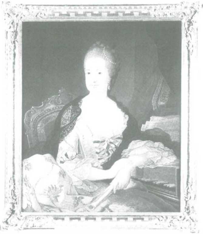
Frau Kurfürstin — voll in Pose