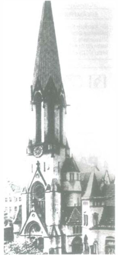
So sah die Friedenskirche vor hundert Jahren aus. Nach ihrem „Todesjahr“ 1943 entstand sie in der heutigen Form.

2. September: Der Bau der Friedenskirche