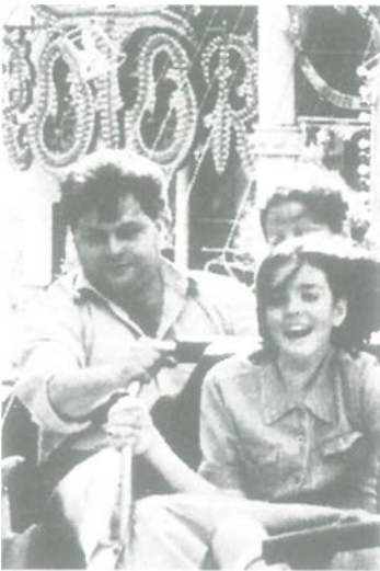
Kirmesvergnügen ante portas

schon Hausfrauen, den Damen der Knaasköpp. Also: Man muß nur Initiative entwickeln.