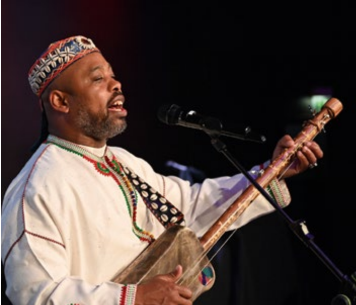
Traditionelle Klänge aus Marokko - Gnaoua-Musik