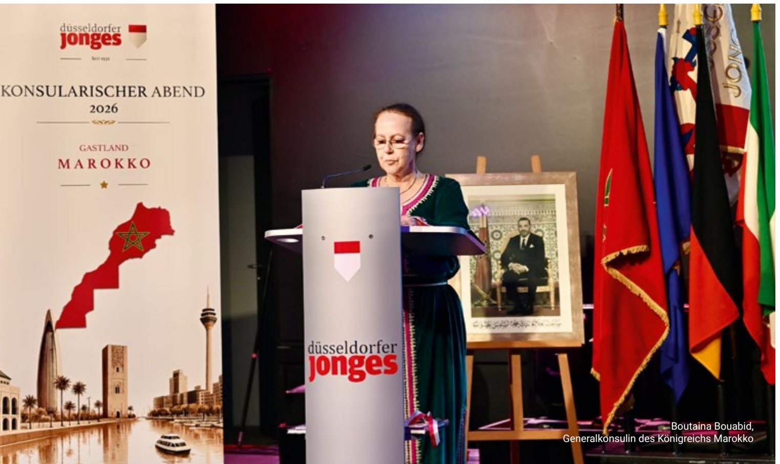
Boutaina Bouabid, Generalkonsulin des Königreichs Marokko