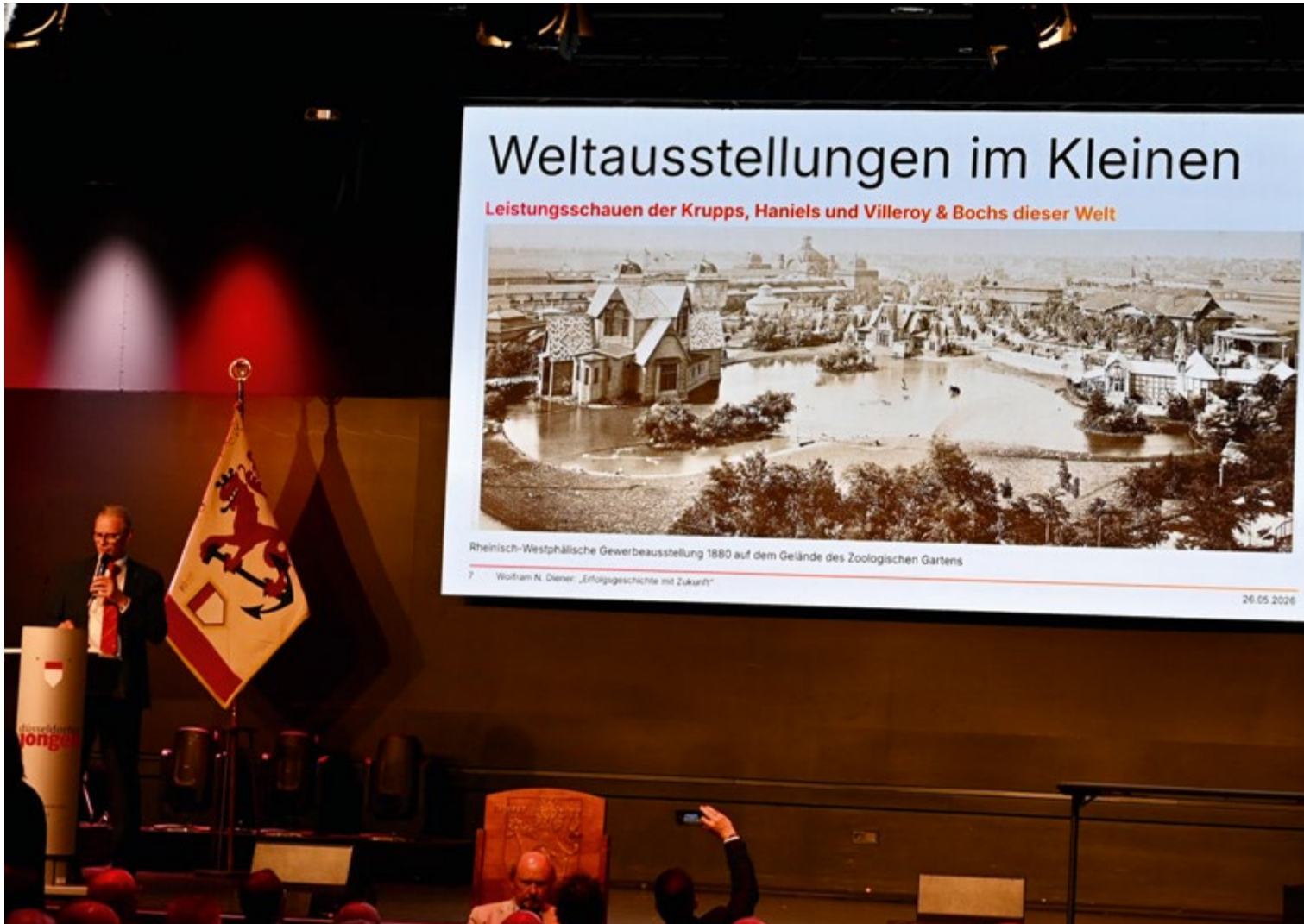
Bereits 1880 war Düsseldorf als Ausstellungsort international gefragt

lung war damit die größte Messe Europas und prägte große Teile des heutigen Rheinufer, zum Beispiel mit dem Ehrenhof und dem Museum Kunstpalast. 1937 nutzten die Nazis dann das Messegelände im heutigen Nordpark für ihre Propaganda – mit der Ausstellung „Schaffendes Volk“.