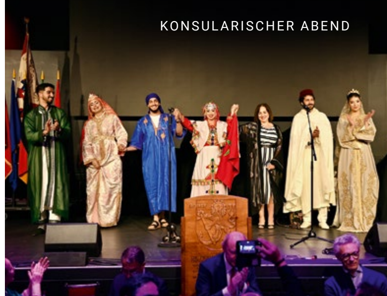
Der marokkanische Kaftan, immaterielles Kulturerbe der Menschheit

Weltmeisterschaft beide Länder mit guten Mannschaften vertreten sind: „Ich wünsche beiden Mannschaften das Beste.“