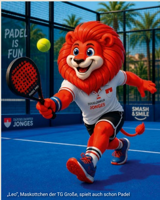
„Leo“, Maskottchen der TG Große, spielt auch schon Padel