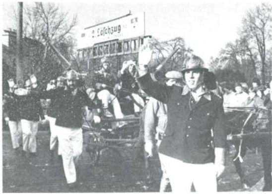
Brauchtumpflege vor Millionen von TV-Zuschauern: 2. Löschzug

Werkes wurde gegründet. Und Hoppeditz lachte! Dann ging es an die technische Arbeit. Leicht gesagt, aber schwer getan. Eine Faszination hatte inzwischen die Gesellschaft ergriffen, sie nannte sich in einer neuen Wortschöpfung „Nostalgie“. Und der Markt der Antiquitäten und ähnlicher Altertümer war wie leergefegt. Über ein Jahr lang wurde ausgespäht, korrespondiert und gereist, bis endlich eine Spritze aus Rothenburg ob der Tauber gemeldet wurde, Baujahr 1850! Sie sollte samstags überführt werden, frei Haus, Kostenpunkt etliche tausend Mark. Und Hoppeditz lachte!