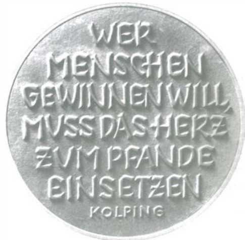
Gedenkmünze zu Ehren des Namensgebers unserer neuen Heimstatt.