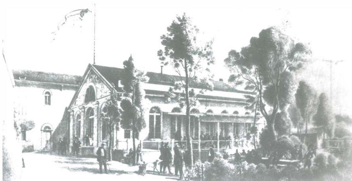
Eine Attraktion für Touristen war einst die „Bairisch-Bier-Brauerei und Restauration zur Bockhalle“ von F. P. Memminger in der Düsseldorfer Poststraße.

kennt den Rochus-Club. Dort sind die Spiele um den World-Cup ein Medien-Ereignis, zugleich ein Treffpunkt der Prominenz. Allerdings fehlt noch die Großhalle, gegen die sich Bürger im Norden noch sperren, die aber — Standort hin oder her — in Düsseldorf dringend benötigt wird. Die DEG als deutscher Eishockey-Meister schon im zweiten Jahr und die sich emsig verbessernde Fortuna Düsseldorf: Unsere Stadt ist im Sport eine wichtige Metropole, auch wenn in der nahen Umgebung viel Konkurrenz lauert, bereit, der Landeshauptstadt eins auszuwischen.