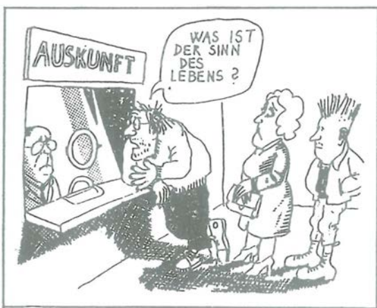
Das ist die Frage aller Fragen...

Düsseldorf verzeichnet seit 1982 einen Aufwärtstrend bei den Übernachtungszahlen. So wurden 1990 rund 2,1 Millionen Übernachtungen registriert, ein Plus von 16,3 Prozent gegenüber dem Vorjahr. Dabei kamen 56,6 Prozent oder rund 1,2 Millionen Besucher aus Deutschland, über 900 000 aus dem Ausland. An der Spitze der ausländischen Besucherskala stehen die Japaner mit rund 112 000 Übernachtungen. Den zweiten Platz belegt Großbritannien mit 106 000, gefolgt von den USA mit knapp 86 000 und Italien mit rund 69 000 Übernachtungen. Die durchschnittliche Verweildauer der Gäste beträgt zwei Tage.