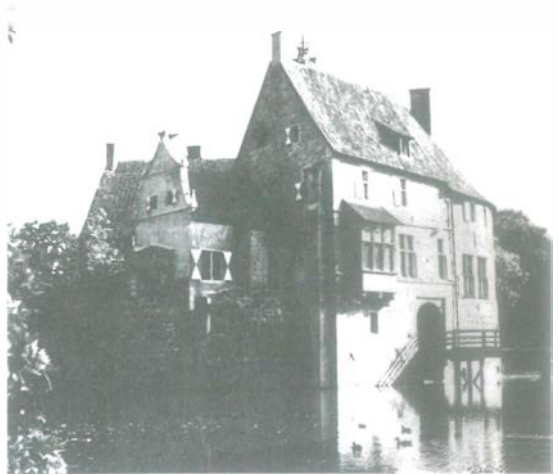
An der „100-Schlösser-Route“: Burg Vischering im Münsterland.

Das Münsterland ist das Radwanderparadies in Deutschland! Nirgendwo anders gibt es so viele Radwege, stille Wirtschaftswege und „Pättkes“ — wie die schmalen Feld-, Wald- und Wiesenwege genannt werden — wie hier im Münsterland, nirgends so viele Fahrräder! An 145 Fahrradstationen stehen mehr als 4 400 Mieträder bereit.