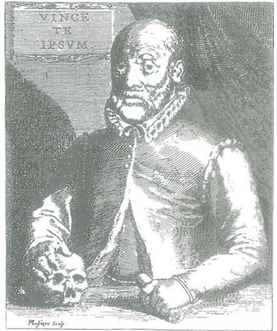
Johann Weyer: Kritiker der Hexenverfolgung.

Hexen sind weiblich. Das steht fest. Unsere Vorstellungen sind genährt aus mittelalterlichen Geschichten und aus Volksmärchen: Alt und bucklig und unheimlich sind diese bössartigen Frauen, die nur darauf aus sind, Schaden