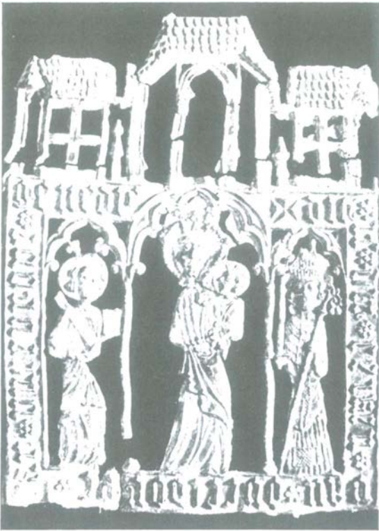
Das Düsseldorfer Pilgerzeichen.

aus Zinn-Blei-Guß mit der Darstellung der am Wallfahrtsort verehrten Heiligen. Das einzige noch bekannte Düsseldorfer Pilgerzeichen befindet sich in der staatlichen Kunstsammlung Kassel (Inv.-Nr. N T 80). Es ist ein Gitterguß von 7,9 cm Höhe und 6,3 cm Breite. Er zeigt in drei in gotischem Maßwerk ausgelegten Nischen in der Mitte die Mutter Gottes, links, mit Buch und Keule, den heiligen Apollinaris und rechts, im Bischofsornat mit Krummstab und Schwert, St. Lambertus: Die umlaufende Schrift in spätgotischer Minuskel: + dit · is · dit · ceiken · van · duseldorpe · dar · unse · vrouwe · genedic +.