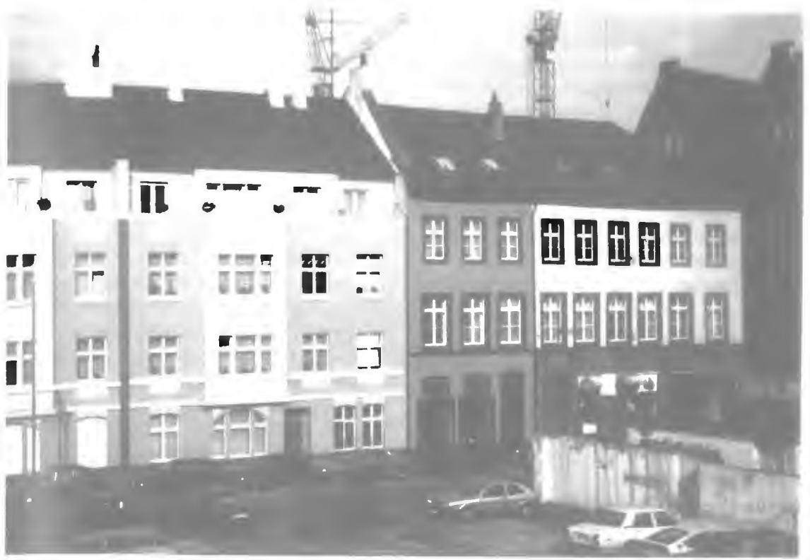
Die erneuerten Giebel an der Straße Altstadt und zwei reizvolle Wappen über der Haustür