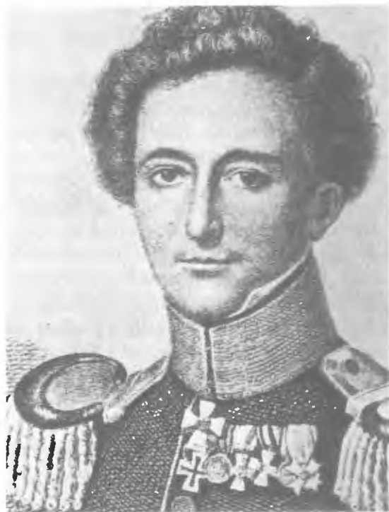
Carl von Clausewitz