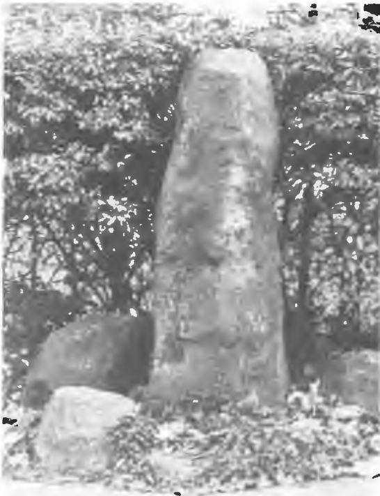
Abb. links: Der Menhir (großer Stein), ein keltischer Opferstein, das älteste Kulturdenkmal am Niederrhein. – Abb. rechts: Ein romantisches Haus, eines der ältesten Baudenkmäler im Geviert des Marienkrankenhauses am Suitbertus-Stiftsplatz. Ob es gelingt, es in diesem Jahr freizulegen?