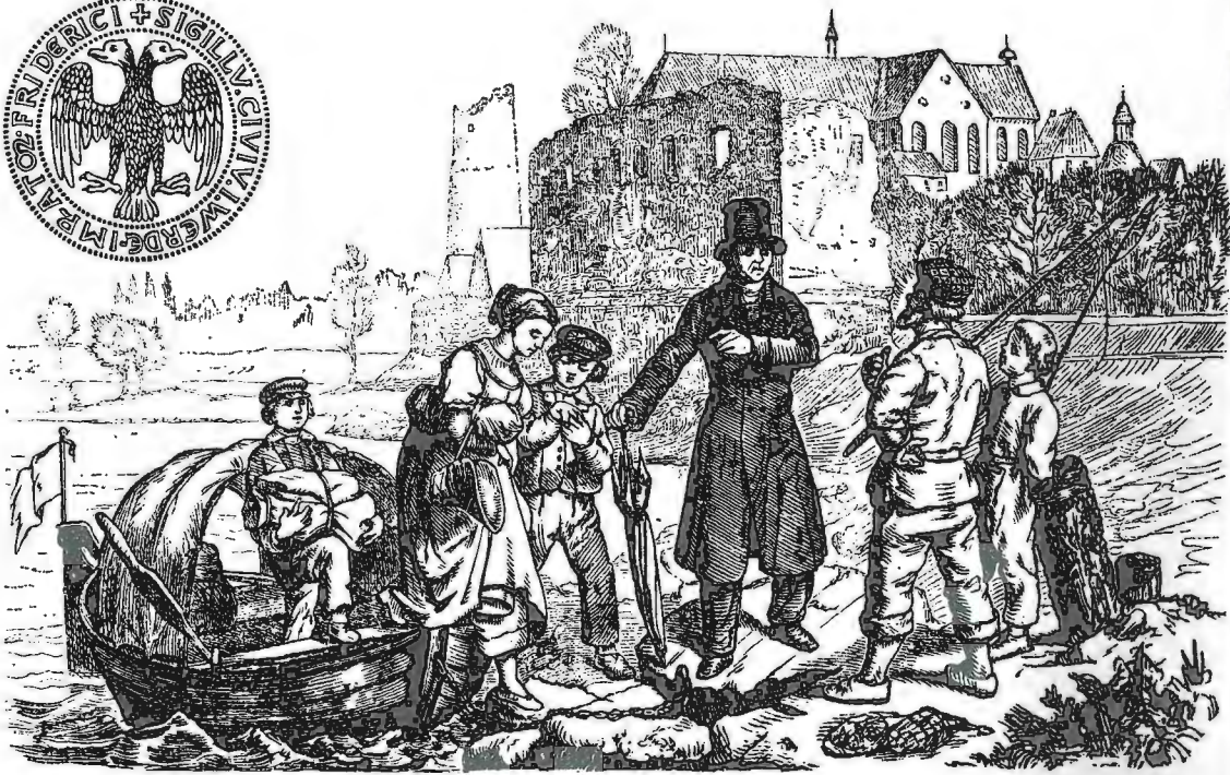
Fliedner landete 1822 mit dem Nachen vom Oberrhein kommend, mit seinen Geschwistern in Kaiserswerth. – Oben links: Das Kaiserswerther Wappen.