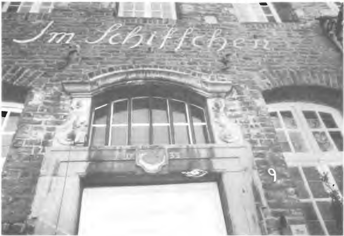
Abb. oben: Eines der schönsten niederrheinischen Barockhäuser am Kaiserswerther Markt. Vermutlich seit 1733 von einem Schiffer oder Zolleinnehmer bewohnt, zeigt es mit Recht als Hauswappen ein „Schiffchen“. – Abb. unten: Vom Kaiserswerther Markt ein Katzensprung in die Straße Am Mühlenturm (rechts), und wir entdecken einen prachtvollen Giebel. Das Haus, 1667 erbaut, hat die Belagerung von 1702 überstanden. Der Besitzer hat sein Heim liebevoll gepflegt.