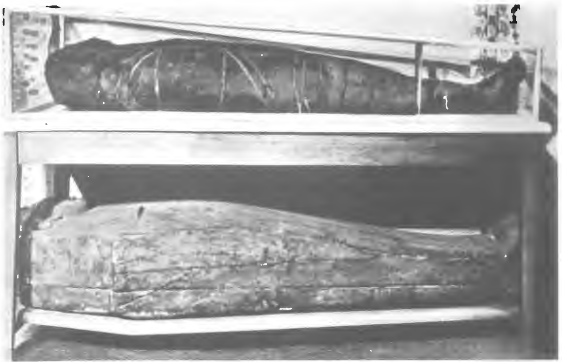
Das Schaustück im Fliednermuseum: eine ägyptische Mumie, die Fliedner von seinen Reisen als Anschauungsmaterial für seine Schulen mitgebracht hatte, als er die Diakonissen-Niederlassungen in aller Welt besuchte (Foto: Diakoniewerk) – Der kostbare Schrein der Kaiserswerther Basilika mit den Gebeinen des heiligen Suitbertus (Foto: Landesbildstelle)