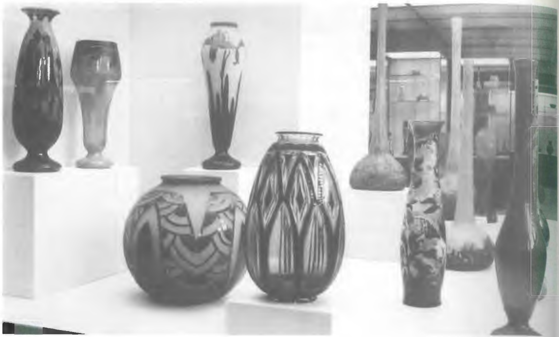
Die Sammlung Hentrich im Kunstmuseum

Viele namhafte Architekten, wie Peter Behrens, Le Corbusier, Walter Gropius, Ludwig Mies van der Rohe und Frank Lloyd Wright, bestimmten die Architektur ihres Zeitalters bis in ihr hohes Alter. Ihr Werk ging jedoch mit ihrer persönlichen Arbeit zu Ende. Nur wenigen Architekten gelang es, ihr Werk unter Beibehaltung des Namens, ihre Qualitätsbegriffe und Architekturvorstellungen zu erhalten, wie z.B. die bekannte Architekten-Sozietät S.O.M. Skidmore Owings & Merrill U.S.A.