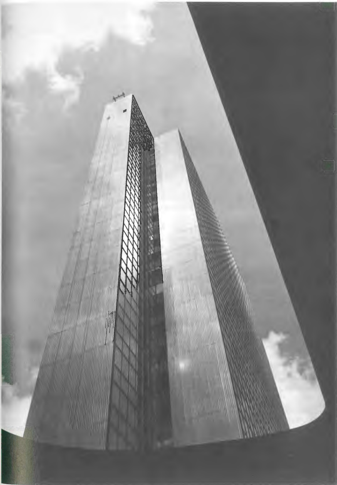
Das Thyssen-Haus