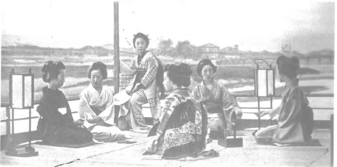
Japanische Schönheiten zeigten sich 1904 in Düsseldorf auf der Großen Kunst- und Gartenbau-Ausstellung

Die Düsseldorfer Niederlassungen japanischer Unternehmen sind oft personell so ausgestattet, daß Europabesucher aus Japan, seien sie nun Mitarbeiter der eigenen Firma, von befreundeten Unternehmen bzw. von Kunden entsandt, Düsseldorf als erste Station ihrer Europareise einplanen, um von hier in Begleitung eines „europakundigen“ Landsmanns weitere Geschäftstermine in anderen Städten und Län-