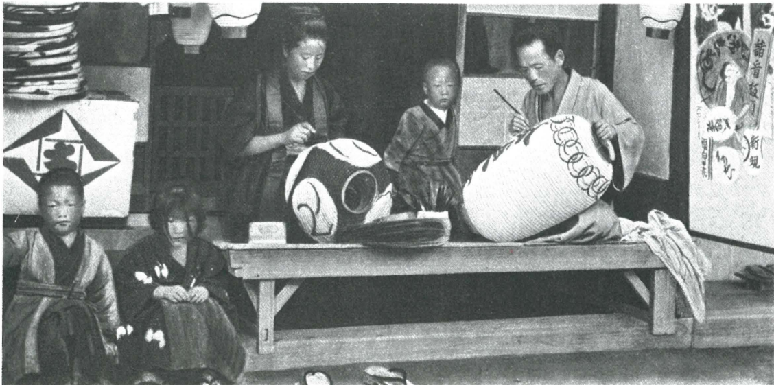
Japanische Lapionmaler zeigten ihre Fertigkeiten auf der „Internationalen Kunst-, Kunsthistorischen und großen Gartenbau-Ausstellung, Düsseldorf 1904

Die Japanischen Wochen in Düsseldorf werden vor allem den kulturellen Hintergrund unserer japanischen Gäste aufhellen. Welche Rolle sie für Düsseldorf als Arbeitgeber, Mitbürger, Steuerzahler spielen und in welchem beachtlichen Umfang sie zur Stärkung der Wirtschaftlichkeit und zum Ruf der Internationalität unserer Stadt beitragen, sollte dabei nicht übersehen werden.